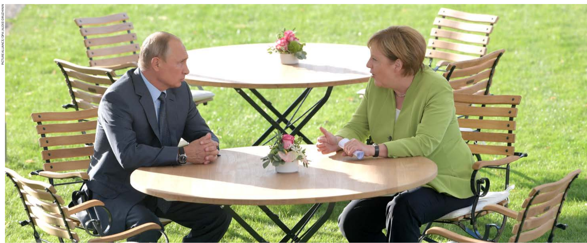
Gipfel im Garten: Angela Merkel und Wladimir Putin in Meseberg 2018