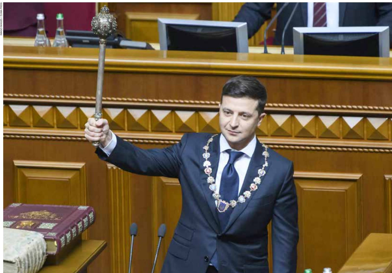
„Sprich leise und höflich, aber trage stets einen dicken Knäuel bei dir“, sagte Theodor Roosevelt einst. Der neue Präsident Wolodymyr Selenskyj mit dem alten ukrainischen Zepter, der Bulawa, dem historischen Symbol der Staatsmacht.

Auf Selenskyj kommen gewaltige Aufgaben zu. Er steckt in einem strategischen Dilemma. Als junger Politiker ohne „belastete Vergangenheit“ genießt er einen großen Ver-